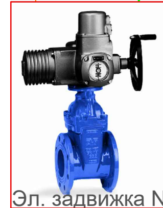
Эл. задвижка N